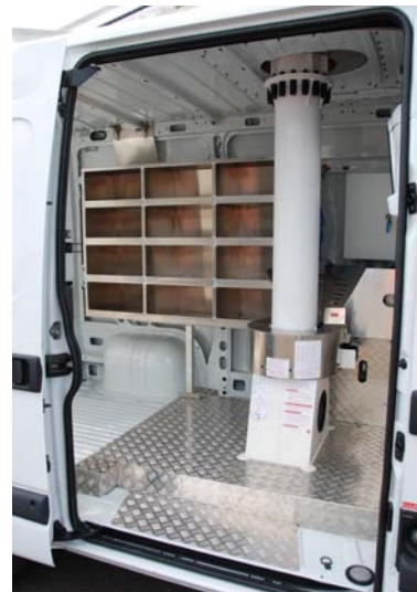
Accès aisé par la porte latérale