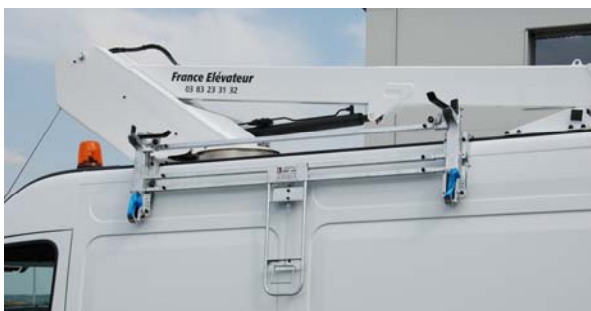
Porte échelle et aménagement en option