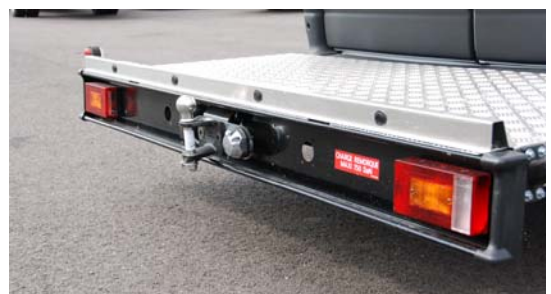
Porte à faux réduit, remorquage homologué UTAC et aide au stationnement en option